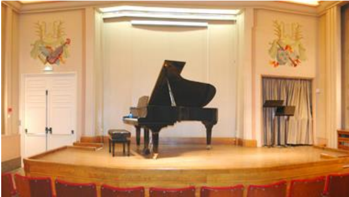
Piano : Ibach Richard Strauss (Le piano reste sur scène)

Escaliers à cour et à jardin donnant sur le parterre.