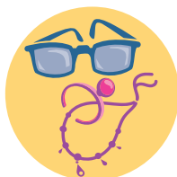
Bijoux & Accessoires (maroquinerie, chaussures...)