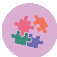
Jeux et jouets