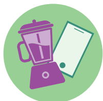
Petits électroménager & équipements numériques