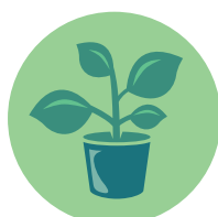
Plantes, graines et petit matériel de jardinage