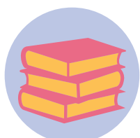
Livres & magazines