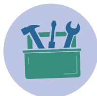
Outils de bricolage